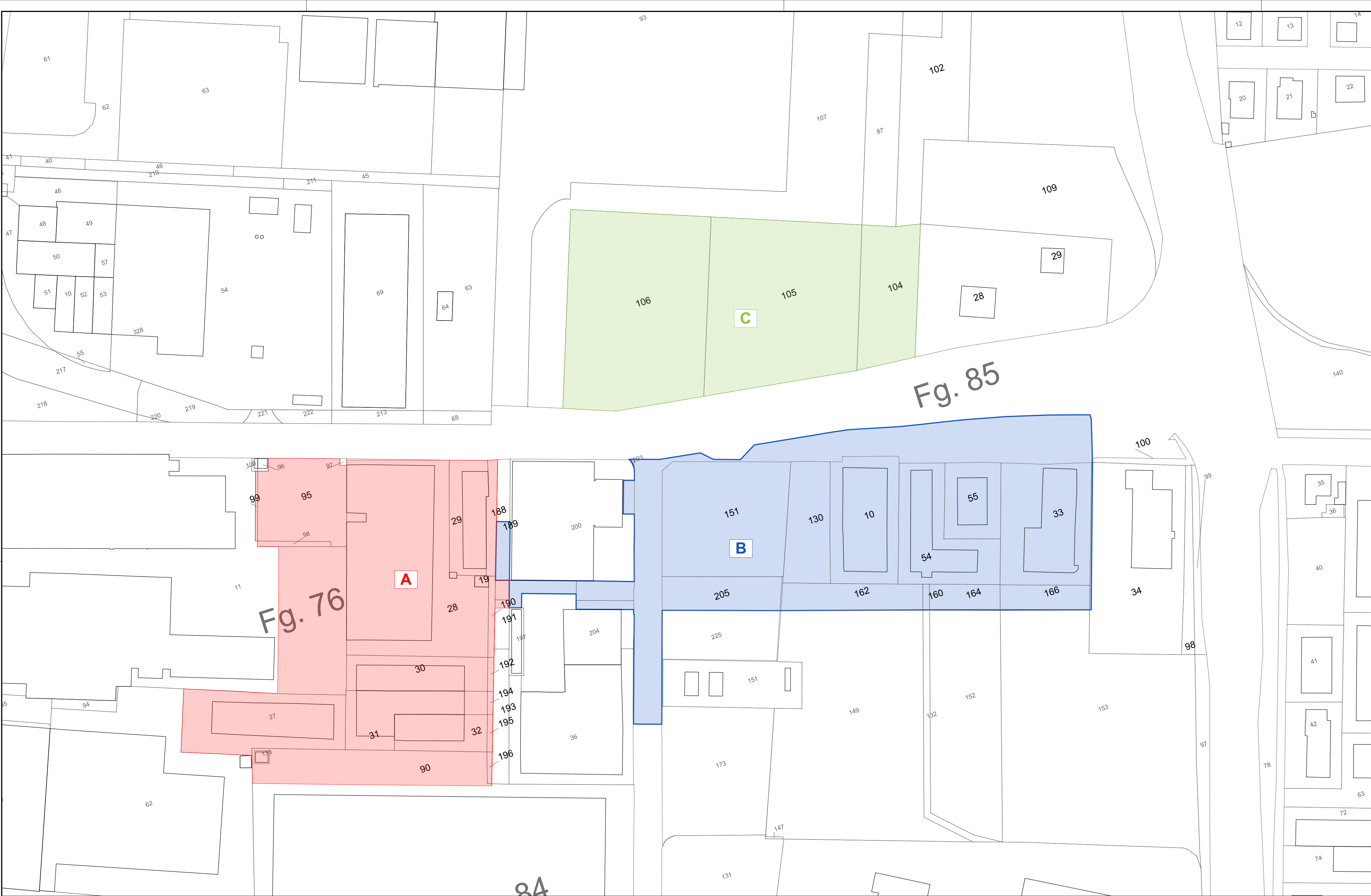
AREE COMPARTO INTERVENTI - ASSETTI CATASTALI